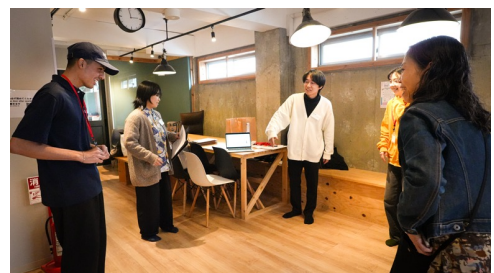
2025年3月 トライアル@8NESTシェアハウス（四条烏丸）